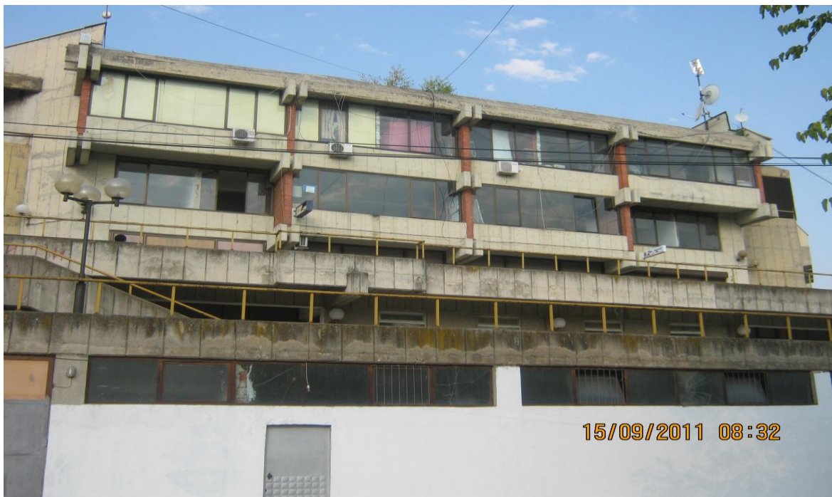
Сл. 7, Дел од постојните прозори на салата

Од аспект на греењето на спортската сала, неопходна е замената на постојните алуминиумски прозори со прозори кои имаат двојно (термопан) стакло, бидејќи голем дел од спортската сала е застаклена со прозори со единечно стакло (сл. 7) при што има големи загуби на топлинска енергија.