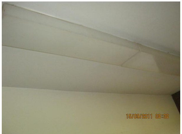
Сл. 2, Осветлување на арената со рефлектори и неонски светла во просториите