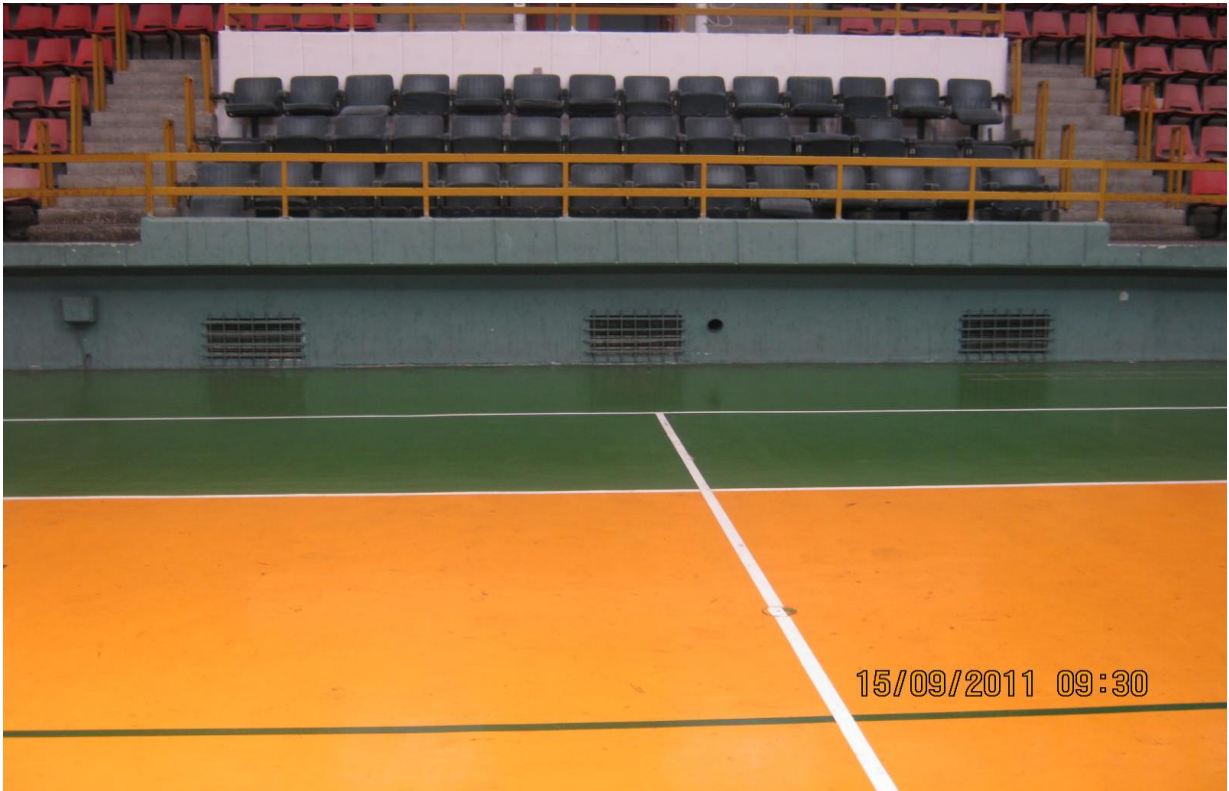
Сл. 6, Изглед и поставеност на дувалките за загревање на салата

Од аспект на греењето на спортската сала, неопходна е замената на постојните алуминиумски прозори со прозори кои имаат двојно (термопан) стакло, бидејќи голем дел од спортската сала е застаклена со прозори со единечно стакло (сл. 7) при што има големи загуби на топлинска енергија.