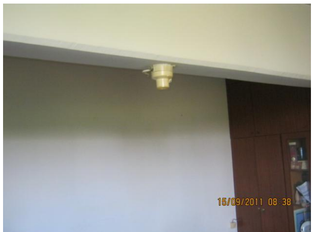
Сл. 3, Паничен и безбедносен систем