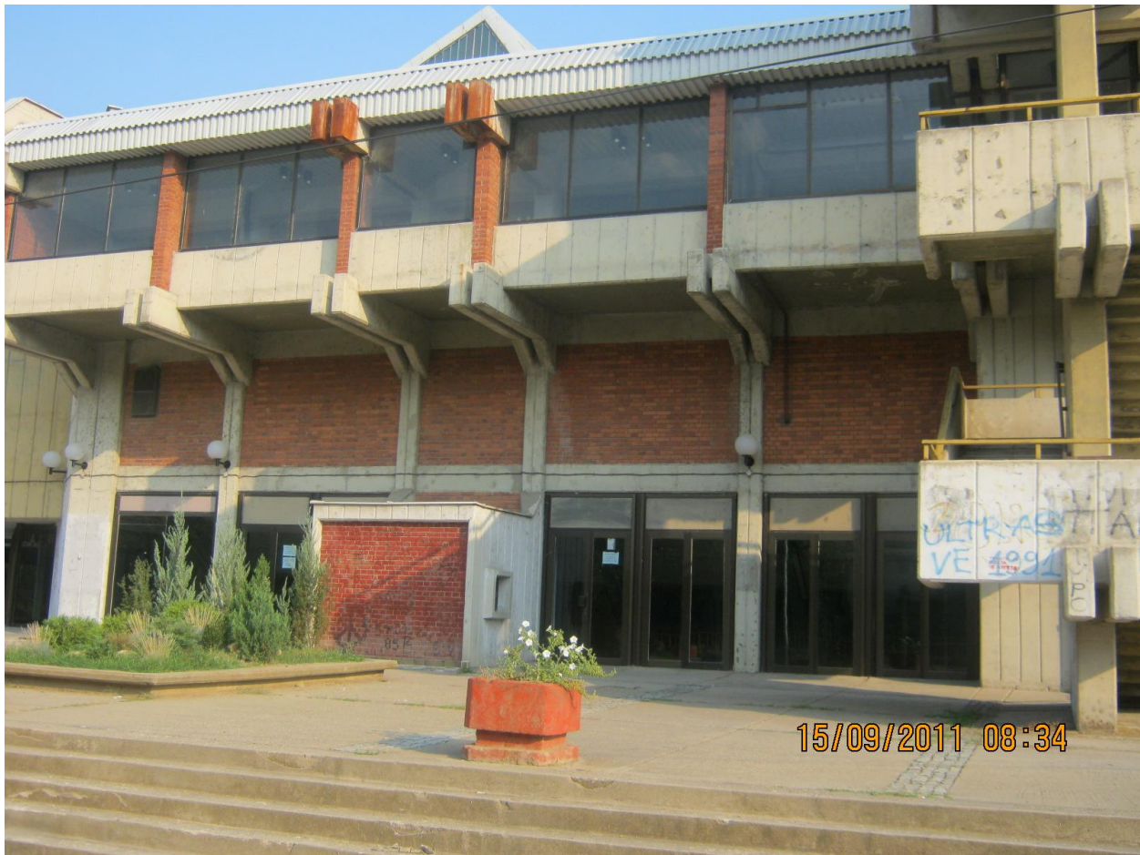
Сл. 1, Преден поглед на спортската сала

Како резултат на несоодветна изолација, лоши прозорци и неизбалансираност на цевната мрежа и системот, постои нерамномерност во затоплувањето, па прилично е тешко во зимски услови да се одржи проектната амбиентална температура во просториите на објектот. Арената и ходниците се решени со климатизација и греење.