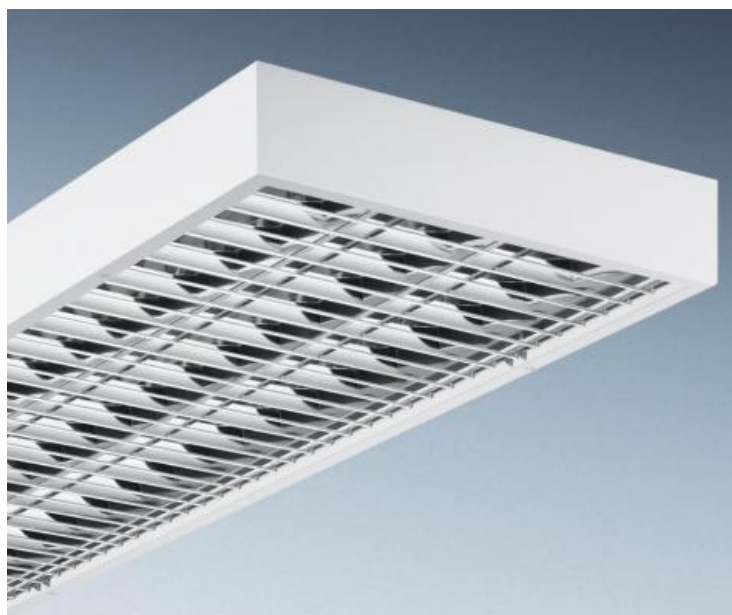
Сл. 8, Изглед на осветлување со T5 сијалици во куќиште